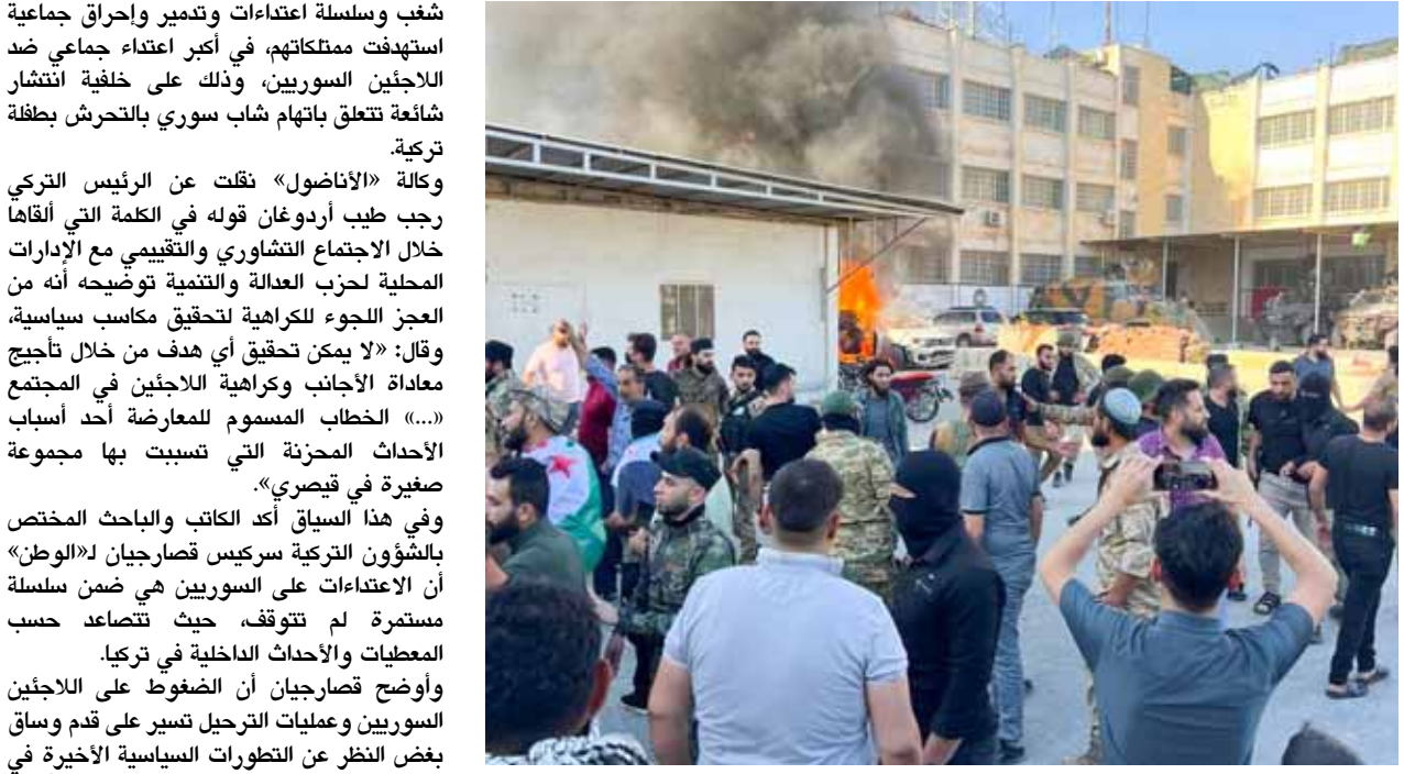
هجوم على نقطة للاحتلال التركي في إدلب

شغب وسلسلة اعتداءات وتدمير وإحراق جماعية استهدفت ممتلكاتهم، في أكبر اعتداء جماعي ضد اللاجئين السوريين، وذلك على خلفية انتشار شائعة تتعلق باتهام شاب سوري بالتحرش بطفلة تركية. وكالة «الإناضول» نقلت عن الرئيس التركي رجب طيب أردوغان قوله في الكلمة التي ألقاها خلال الاجتماع التشاوري والتقييمي مع الإدارات المحلية لحزب العدالة والتنمية توضيحه أنه من العجز اللجوء للكرامية لتحقيق مكاسب سياسية، وقال: «لا يمكن تحقيق أي هدف من خلال تاجيج معاداة الأجانب وكراهية اللاجئين في المجتمع (...)» الخطاب المسموم للمعارضة أحد أسباب الأحداث الممحنة التي تسببت بها مجموعة صغيرة في قيصرية. وفي هذا السياق أكد الكاتب والباحث المختص بالشؤون التركية سركيس قسارجيان لـ«الوطن» أن الاعتداءات على السوريين هي ضمن سلسلة مستمرة لم تتوقف، حيث تتصاعد حسب المطبات والأحداث الداخلية في تركيا. وأوضح قسارجيان أن الضغوط على اللاجئين السوريين وعمليات الترحيل تسير على قدم وساق بغض النظر عن التطورات السياسية الأخيرة في إشارة إلى التصريحات الصادرة من دمشق وأنقرة بشأن التقارب التركي- السوري، أو الأحداث التي تقع داخل تركيا. منوهاً بأن السبب هو أن ملف اللاجئين أصبح يشكّل نقلاً على الحكومة التركية التي باتت عاجزة عن الخروج من تحت وطأة هذا الملف، خاصة في ظل الضغوط المستمرة من خصوم أردوغان في المعارضة، وحتى من شريكه في السلطة دولت بهنشللي، بضرورة حل هذه المشكلة التي ظهرت بشكل أكبر بعد الأزمة الاقتصادية الخانقة التي تصف بتركيا.