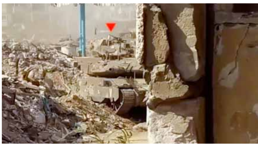
القائمة الفلسطينية تستهدف أليات لجيش الاحتلال الإسرائيلي في غزة

مجدداً نحو شارع صلاح الدين في مدينة غزة. من جانبها أعلنت المقاومة اللبنانية استهداف مبان يستخدمها جنود الاحتلال الإسرائيلي في مستعمرة «غرانوت هجيل»، وإصابتها إصابات مباشرة، وأكدت أنها ردت على الاعتداءات على بلدة بليدا، عبر استهداف مبان يستخدمها جنود الاحتلال الإسرائيلي في مستعمرة «كفرجعادي» بالأسلحة الملائمة، وتمت إصابتها إصابات مباشرة. يأتي ذلك في وقت تحذرت فيه صحيفة «وول ستريت جورنال» عن إعادة المقاومة الفلسطينية في قطاع غزة تصنيها لقوات الاحتلال الإسرائيلي، لليوم 69 بعد المئتين، منفذة عمليات نوعية تركزت على مدينة غزة، وجنوب القطاع، محققة إصابات مؤكدة في صفوفه واليائه. وتصتت المقاومة لمحاولة قوات الاحتلال التقدم