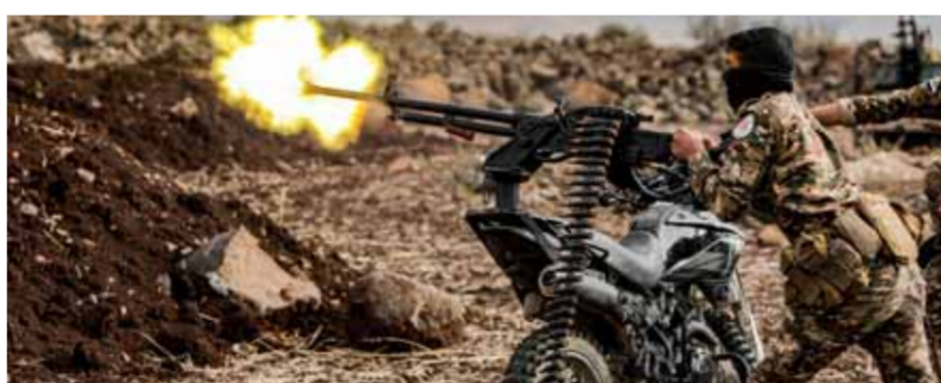
مليشيات تابعة لجيش الاحتلال التركي في عفرين

عملية تسلل نحو قاعدة الاحتلال التركي في البحوث العلمية شرق إزاز شمال حلب، تلتها عملية تسلل أخرى نحو قاعدة الاحتلال في كنجبرين قرب مارح 3 عمليات تسلل في 12 و22 الشهر الجاري باتجاه نقاط جيش الاحتلال في قريتي حرمل والفوز غرب مدينة الباب بريف المحافظة الشمالي الشرقي، ما أدى إلى إصابة 4 مسلحين في صفوف مليشيات أنقرة. في المقابل، نفذت مليشيات الإدارة التركية 3 عمليات تسلل في 21 و22 الشهر الجاري في محوري بلنتي الجراد وعرب حسن بريف منبج شمال شرق حلب، حيث مجلس منبج العسكري التابع ل«قسد»، الذي ذكر أنه أحبط محاولتي تسلل وأوقع جرحى لدى المليشيات.