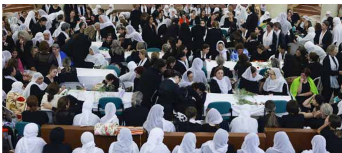
من تشييع القتلى والأطفال في بلدة مجدل شمس بعد الجريمة التي ارتكبها الاحتلال الإسرائيلي

تحذيرات دولية من مغبة توسيع الحرب.. واشنطن: قد يخرج الوضع عن السيطرة.. الإليزيه: لا نريد تصعيداً جديداً