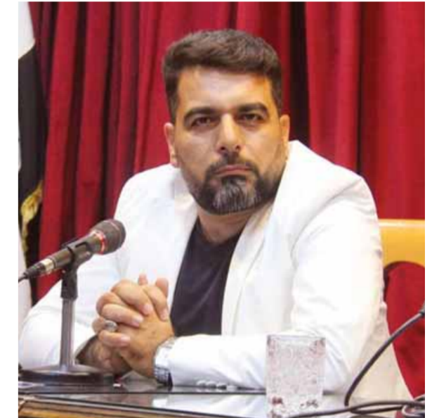
محمد الهوراني رئيس اتحاد الكتاب العرب