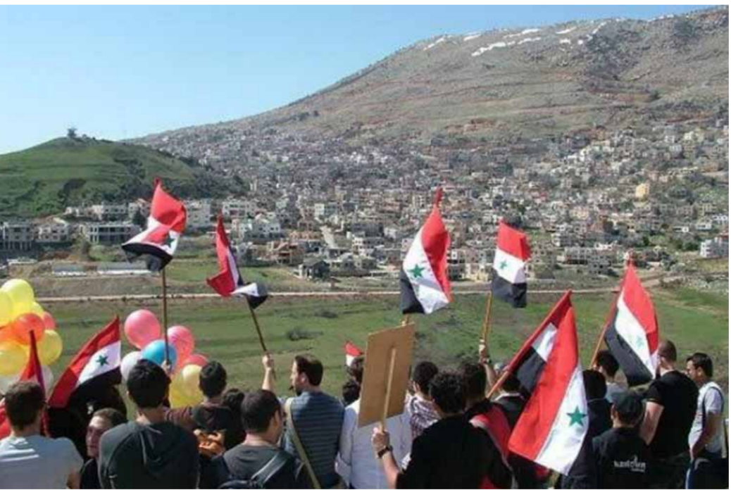
وقفة تضامنية في موقع من التينة المقابل لميدان جبل شمس مع أهالي الجولان العربي السوري المحتل بمناسبة عيد الجلاء

حذرت سورية من أن التصعيد الخطير في المنطقة المحتل باستمرار الاحتلال الإسرائيلي في ارتكاب جرائم الإبادة الجماعية بحق الشعب الفلسطيني، وإيمانه في شن اعتداءات على عدد من دولها بما فيها سورية، يهدد بإشغال المنطقة برمها وتفجيرها، مؤكدة أن ما يزيد من المخاطر المحدقة بقيام دول غربية، وفي مقدمتها الولايات المتحدة بتجريد أساطيلها وجيوشها تصرفه للتطبيع، ليزداد إيماناً في جرائمه وقاقت سورية في بيان الغشاء نائب المندوب الدائم لدى الأمم المتحدة المحم نذري أمس خلال جلسة لمجلس الأمن حول الشائين الأساسيين والإساق في سورية: «تجمع اليوم في الوقت الذي تشهد فيه منطقتنا تصعيداً خطيراً يهدد جزيءً أصيلاً من الشعب السوري، وهم يتأثره على العالم أجمع وليس على المنطقة فقط، وذلك جراء استمرار الاحتلال الإسرائيلي وبمطعمون إلى إنتهائه ووضع حد لمراسلة الإجماعية بحق الشعب الفلسطيني في قطاع غزة، وإيمانه في باستعادة الجولان المحتل كاملاً، وهو حق ثابت لا يخضع للاستقامة أو الضغوط، ولا يسقط بالتقادم، يقفله القانون الدولي وقراءات الأمم المتحدة ذات الصلة، وخاصة قرار مجلس الأمن ٤٩٧ لعام ١٩٨١». وتابع نذري: «يجد وقد باتت التأكيد على ما تضمنته الرسائل المتتالقاتان اللتان وجهتها سورية إلى الأمين العام