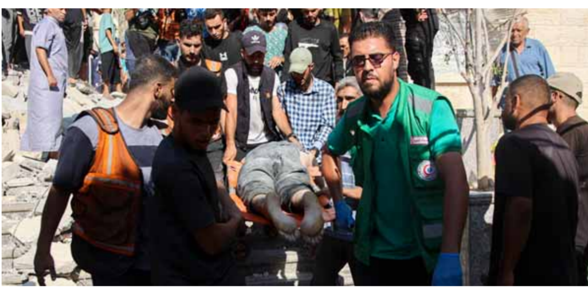
شهداء خلال قصف إسرائيلي على مدرسة النصر التي تؤوي فلسطينيين نازحين غرب مدينة غزة

٢٢ المجازر في غزة تتواصل وأكثر من 30 شهيداً في قصف لمدرستين في القطاع