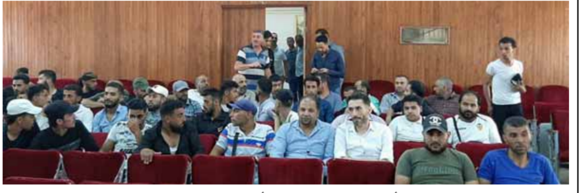
تسوية أوضاع المشرات من المطلوبين من أبناء القنيطرة وريفها