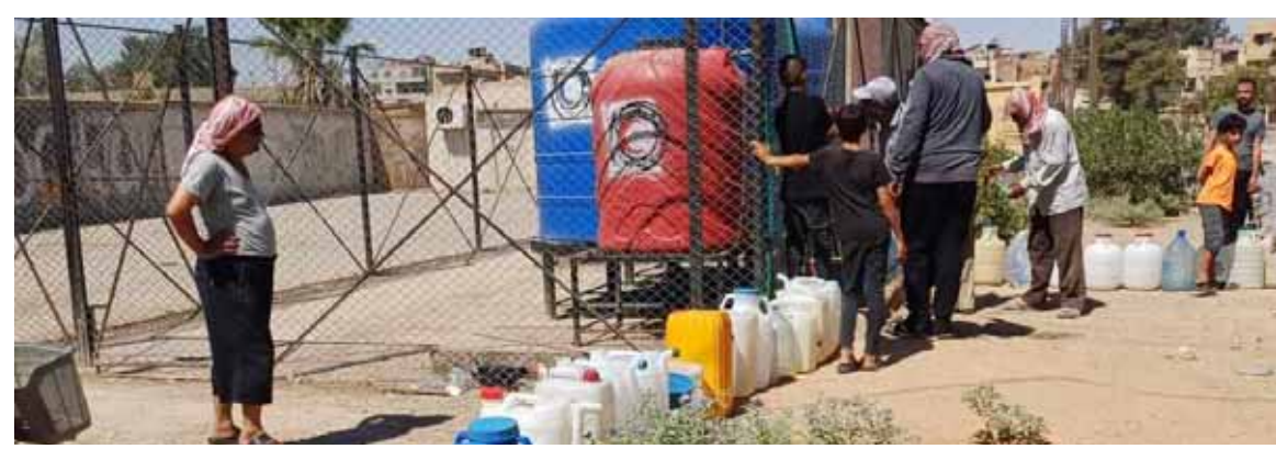
مليشيات «قسد» الانفصالية تواصل حصار مدينة الحسكة لليوم السادس وقطع مياه الشرب والمواد الغذائية عن الأهالي في مدينة الحسكة (الوطن)

الديمقراطية- «قسد»، الموالية لقوات الاحتلال الأميركي، في ريف دير الزور الشرقي، وامتدت المواجهات إلى بلدة الكبر بريف المحافظة الغربي، في وقت بدأت الميليشيات بهدم وتفجير منازل المدنيين لردعهم عن الخروج ضدها. وأوضحت مصادر محلية بريف دير الزور الشرقي أن قوات العشائر العربية شنت الليلة قبل الماضية هجمات باتجاه تجمعات «قسد» في بلدتي الحوايج والبصرة جنوب شرق المحافظة، وكبدتها خسائر في الأرواح، استعدت عنها الميليشيات تعزيزات إلى المنطقة وعدت إلى تمشيط البلدين بحثاً عن مطلوبين. وأشارت إلى أن مواجهات قوات العشائر العربية مع «قسد» امتدت الليلة قبل الماضية إلى بلدتي الكبر والهروموشية غرب دير الزور، حيث داهم مقاتلو العشائر نقاط وحواجز الميليشيات عند مدخل البلدين، وتمكنوا من قتل 7 مسلحين وإصابة 8 آخرين بعد تدمير نقطتين عسكريتين.