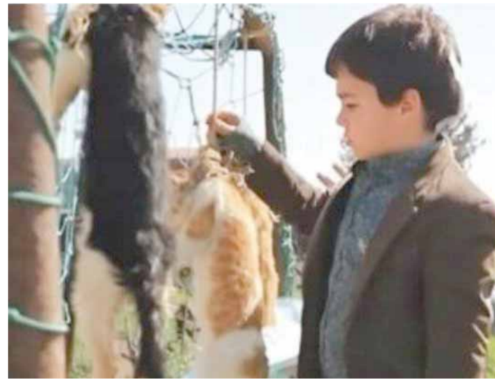
من مسلسل «ولاد بديعة»