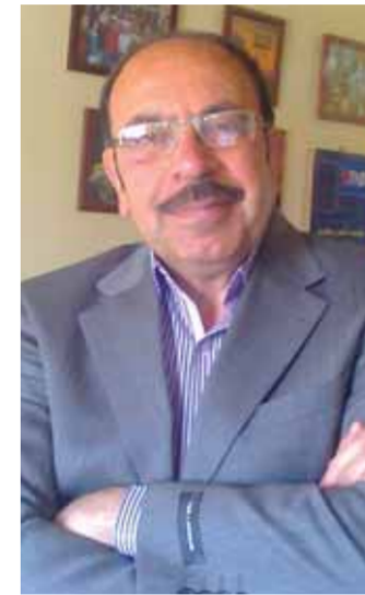
المخرج رشاد كوكش