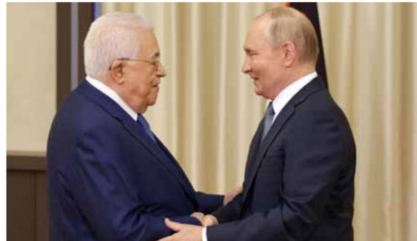
الرئيس الروسي فلاديمير بوتين خلال لقائه الرئيس الفلسطيني محمود عباس في موسكو أمس

الأمد وموثوق ومستقر في الشرق الأوسط، من الضروري تنفيذ جميع قرارات الأمم المتحدة، وقبل كل شيء، إقامة دولة فلسطينية قابلة للحياة. من جانبه، أشاد عباس بمواقف موسكو، وقال إن «روسيا وفلسطين تربطهما عقود من الصداقة»، وأضاف: «نتشعر أن روسيا هي أحد أعز أصدقاء الشعب الفلسطيني، وكما قلت في بداية اللقاء، نأمل أن يحصل الشعب الفلسطيني على دولته الخاصة». ونظر إلى الوضع الحالي في غزة، مشدداً على الأهمية القصوى للتوصل إلى اتفاق لوقف النار، وأكد رفض سياسة التهجير القسري للفلسطينيين من قطاع غزة، وقال: «لن نقبل ترحيل الفلسطينيين من قطاع غزة والضفة الغربية والقدس كما حدث مرات عديدة في القرن العشرين، ونعتقد أنه بدعمك من هذا الهدف». صحيفة «الشرق الأوسط» السعودية نقلت عن مصدر روسي توضحه بأن موسكو كانت مهمة بإجراء مراجعة شاملة للعلاقات مع الجانب الفلسطيني، على ضوء التطورات اللاحقة التي شهدتها الأراضي الفلسطينية، وكذلك على ضوء المستجدات الإقليمية والدولية، لكن المصدر أشار إلى أن الاهتمام الروسي منصب في هذه المرحلة على ضرورات التوصل إلى وقف بأسرع وقت للقتال في غزة، ومعالجة الملفات المتعلقة بهذا الموضوع، بما في ذلك على صعيد منع انزلاق الوضع الإقليمي نحو مواجهة كبرى. على صعيد مواز، قال موقع «أكسيوس» نقلاً عن مصادر: إن وزير الخارجية الأمريكي أنتوني بلينكن، أجل زيارته إلى الشرق الأوسط ولن يتوجه إلى المنطقة، كما كان مقرراً أن يتم ليلة أمس، حسبما أوردته وكالة «رويترز».