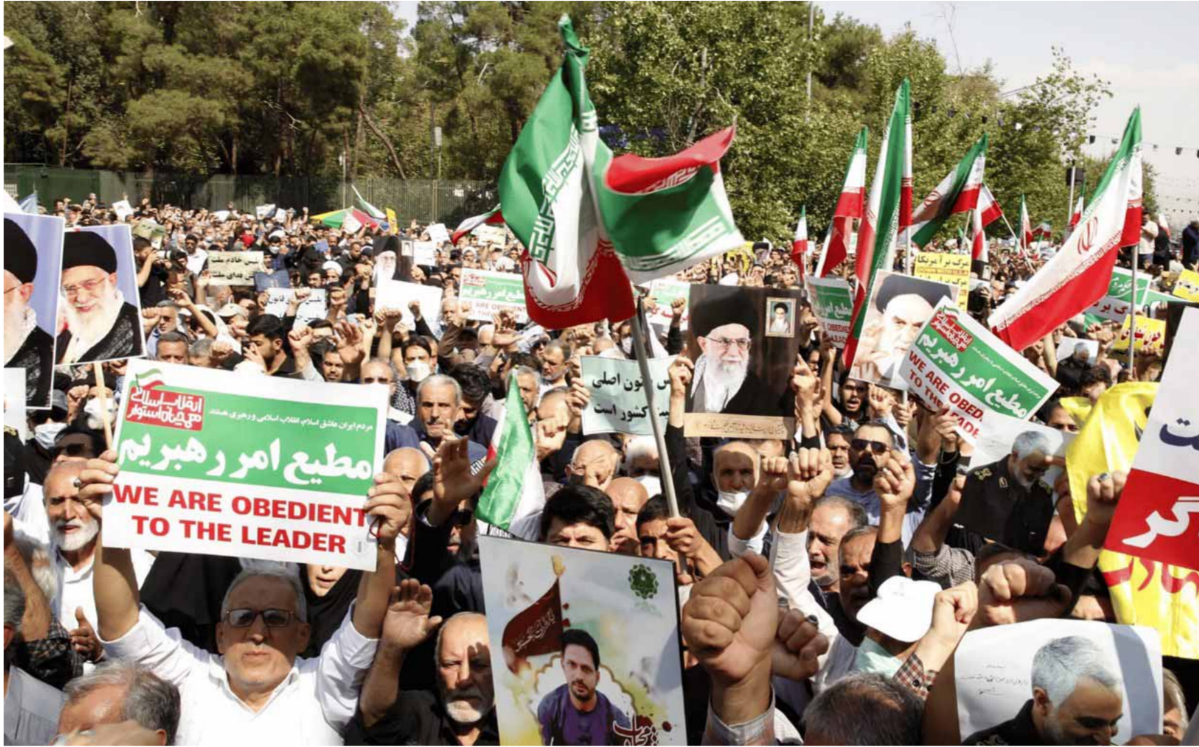
طهران اتهمت «NED» بتأجيج التظاهرات التي شهدتها مدن إيرانية أثناء احتجاجات الحجاب في ٢٠٢٢

في ٢٠٢٢ اندلعت الاحتجاجات ضد ما يسمى «قواعد الحجاب» في إيران، ونشر مسيح على نجاد، مراسل خدمة صوت أميركا الفارسية،