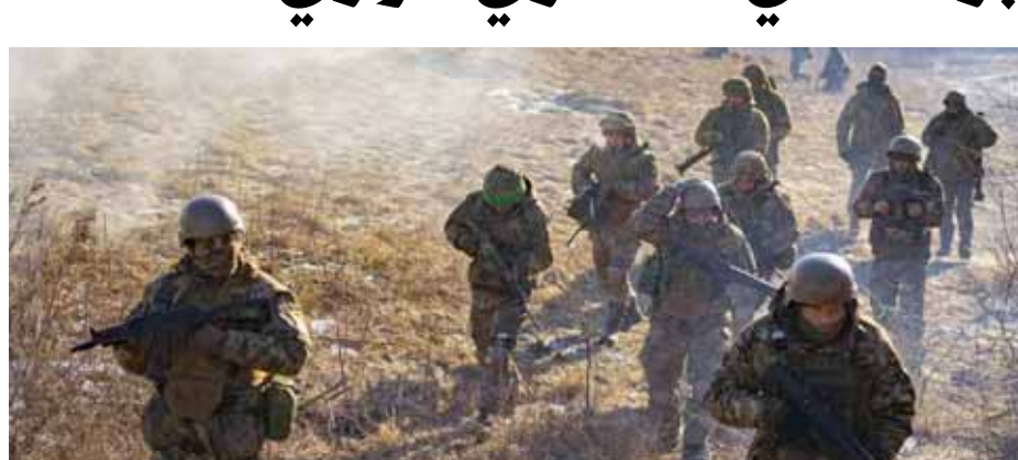
الجنود الأوكرانيون يدؤوا بالاستسلام بشكل متزايد في مقاطعة كورسك

تحذير الدفاع الروسية تزامن مع إقرار عسكريين أوكرانيين بهذا الأمر، إذ أعلنت الإدارة العسكرية لمقاطعة خاركوف، أمس السبت، أن القوات المسلحة الأوكرانية تعزّم القيام بهجوم على المنشآت النووية الروسية في المناطق الحدودية، بينها محطة كورسك في كورنشتاتوف ومحطة زابورجيه للطاقة النووية، وجاء إعلان الإدارة بعد عملية استجواب لأسرى تابعين للوحدة 82 في القوات المسلحة الأوكرانية، حيث أكدوا أن كيف تعزّم القيام بهجوم على المنشآت النووية الروسية، بما فيها في كورسك وزابورجيه. في سياق متصل، أعلن قائد قوات «أخات» الخاصة الروسية، نائب مدير الإدارة السياسية العسكرية بوزارة الدفاع الروسية، اللواء أيتي علاء الدينوف، أن العسكريين الأوكرانيين يدؤوا بالاستسلام «بشكل متزايد» في مقاطعة كورسك الروسية. وقال علاء الدينوف: «في جميع المناطق التي نوجد فيها،