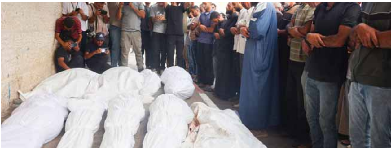
فلسطينيون ينعون أقاربهم الذين استشهدوا في غارة إسرائيلية في مستشفى شهداء الأقصى في دير البلح وسط قطاع غزة (أ ب)

وسط القطاع، بالتزامن مع ارتفاع حصيلة الضحايا الطبيعية الحقيقية للكيان الصهيوني والجرائم التي مازال يرتكبها منذ قيامه وحتى الآن». وفي وقت سابق من أمس أكتت وزارة الصحة العامة أختين نتيجة اعتداء العدو الإسرائيلي بعد منتصف الليلة الماضية على منطقة وادي الكفور في النبطية جنوب لبنان. بالتوازي واصل الاحتلال الإسرائيلي ارتكاب جرائم الإبادة الجماعية بحق الفلسطينيين في قطاع غزة لليوم الـ61، وحذرت وكالة غوث وتشغيل اللاجئين الفلسطينيين (أونروا) من تقليص إسرائيل «المنطقة الإنسانية» المزعومة، في حين طالب جيش الاحتلال، أمس السبت، بإخلاء مناطق واسعة في المغازي