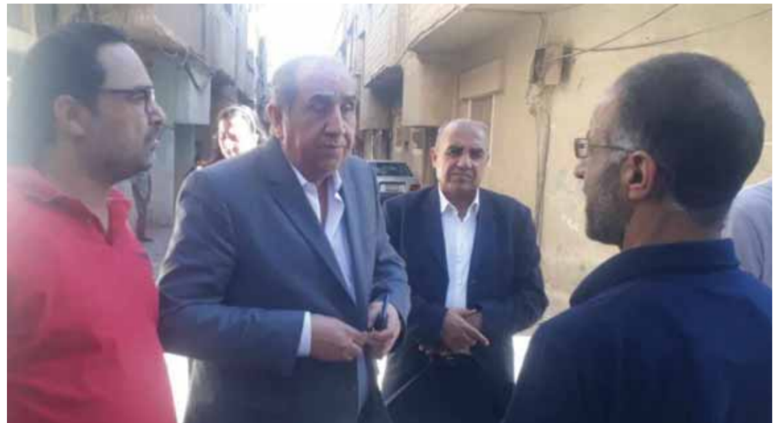
المقنطرة - خالد خالد

استجابة لما نشرته «الوطن» حول واقع النظافة في تجمع جديدة عرطوز الفضل، قام محافظ القنيطرة معز أبو النصر جمران بجولة اطلاعية على التجمع للوقوف على واقع النظافة، وجمال في الأحياء والشوارع الرئيسية والفريعة، حيث لوحظ أن واقع النظافة جيد، وبيد الحاويات فارغة. وأكد المحافظ في تصريح لـ«الوطن» المتابعة المستمرة لمواقع الوحدات الإدارية، وخاصة ما يتعلق بموضوع النظافة وترحيل القمامة وتحسين الوضع البيئي، مبيّناً أن جميع آليات الوحدة الإدارية تعمل بشكل جيد. وأضاف: تم دعم البلدية بإعادة صيانتها ١٧٥ مليوناً من الموازنة المستقلة لصيانة الطرق في جديدة الفضل، وفي حال احتياج البلدية لدعم إضافي فلن تبخل المحافظة في تقديمه، موضحاً بأن عدد الحاويات التي سيتم تصنيعها وإعادة صيانتها ٥٠ حاوية، ليصل بذلك عدد الحاويات الموزعة بأحياء وشوارع التجمع إلى ١١٥ حاوية. واعتبر المحافظ أن بلدية جديدة الفضل من الوحدات الغنية وإيراداتها خلال العام الحالي بلغ ٥٦٧ مليون ليرة من خلال السوق المحلي والخزائن المحروقات والجبائية، مشيراً إلى أن الإنفاق حتى تاريخه بلغ ١٣٤ مليون ليرة.