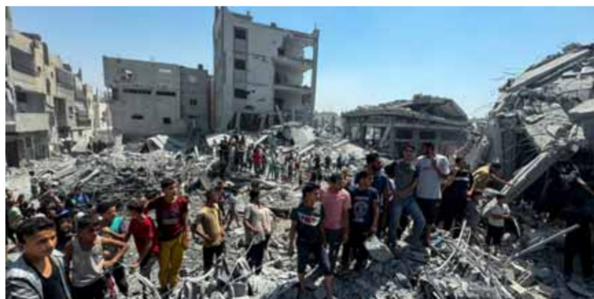
فلسطينيون عند أنقاض منازلهم بعد تصف الاحتلال الإسرائيلي

فلسطين، إطلاق عملية «عرب المخيمات»، على المعركة التي يخوضها مقاتلوها ضد اللوغ الإسرائيلي في الضفة الغربية.