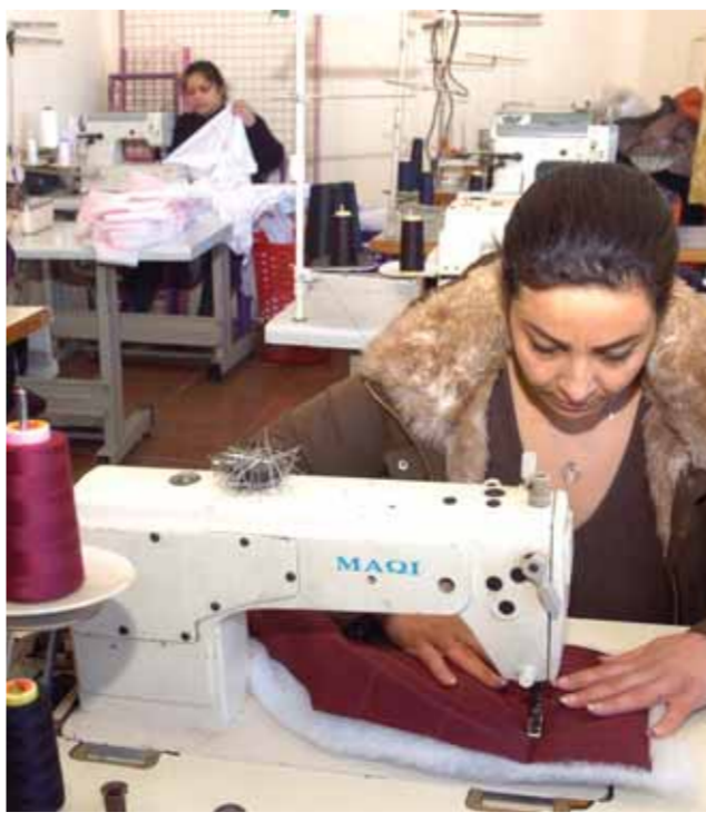
صغيرة جديدة تدعم المشروعات الصغيرة.

عملها يتطلب مادة الغاز بشكل دائم الأمر الذي يعرقل عملها كثيراً، وهي كمشروع صغير لا يمكنها دائماً دفع ثمن الغاز من السوق السوداء الذي بلغ ٣٥٠ ألف ليرة، مطالبة أن تكون هناك جهة مختصة بالمشروعات الصغيرة لدعمها بالحد الأدنى في تكاليف الإنتاج ولو في بداية المشروع بطرق فريدة ومبتدئة لسد حاجات الأسرة في هذه الظروف الاقتصادية الصعبة. وشهدت المحافظة مئات هذه المشروعات على امتداد جغرافيتها التي معظمها تتركز في الأرياف والمدن الصغيرة، وكان للسيدات والنساء حصة لا بأس بها لإعالة أسرة أو تنمية موهبة، وأخرى لشبان وجدوا أن الوظائف اليوم سواء في القطاع الخاص أم العام لم تعد كافية لتلبية الحاجات الضرورية نتيجة روايتها المتدنية.