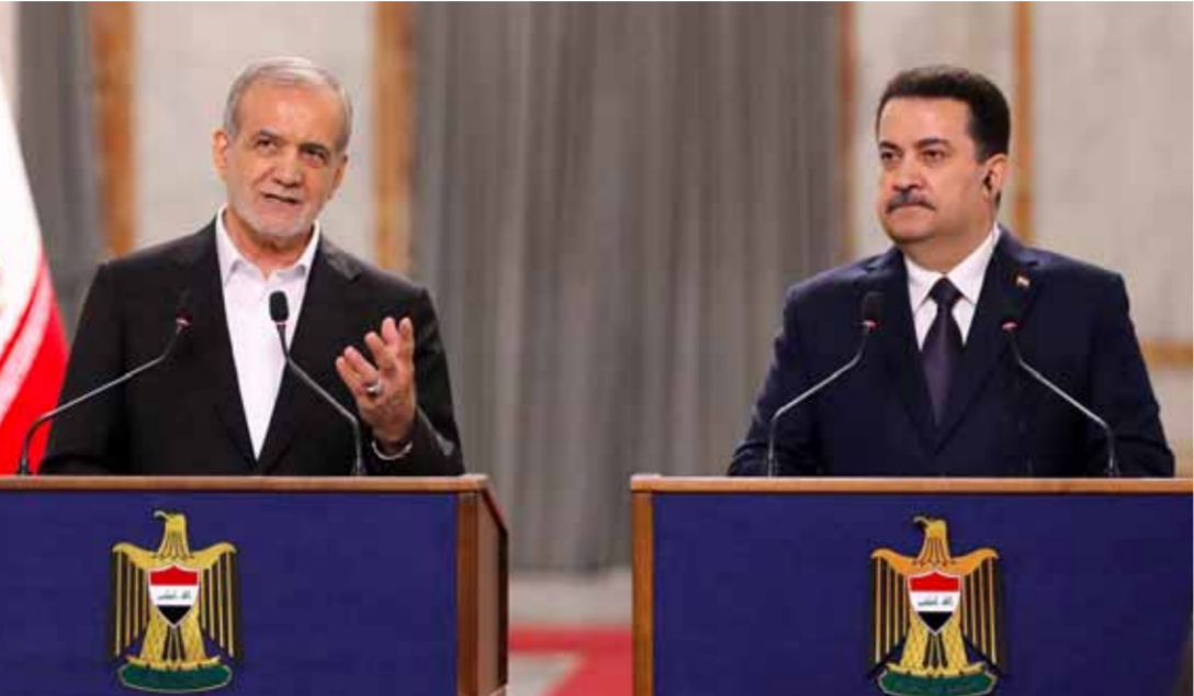
رئيس الوزراء العراقي محمد شياع السوداني والرئيس الإيراني محمود زبشكيان خلال المؤتمر الصحفي المشترك في قصر الحكومة ببغداد

أعلن رئيس الوزراء العراقي محمد شياع السوداني، توقيع ١٤ مذكرة تفاهم مع نظيره الإيراني محمد زبشكيان، في بغداد. وقال السوداني، «توقيع هذه المذكرات هو خطوة مهمة نحو تعزيز العلاقات الاستراتيجية بين العراق وإيران». وقال زبشكيان، «نحن نرحب بهذه المذكرات ونأمل أن تكون بداية لعلاقة جديدة بيننا».