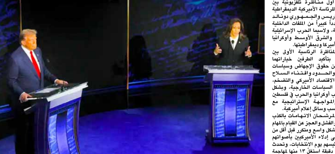
منظرة تلفزيونية بين المرشحين للرئاسة الأميركية الديمقراطية كمالا هاريس والجمهوري دونالد ترامب (من اليمين)

ترامب، الذي يستقيل الانحياز لشعار مشروع قانون أمن الحدود الذي أعدته إدارة ترامب، في مقابلة مع قناة الجزيرة، قال إن الانتخابات الأمريكية ستعكس ما فعلته هاريس في البيت الأبيض. وقال ترامب، «الانتخابات الأمريكية ستعكس ما فعلته هاريس في البيت الأبيض».