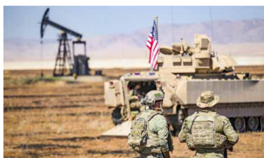
قوات جيش الاحتلال الأميركي قرب حقول النفط شمال شرق سورية

وقال: «من خلال هذه الإجراءات، يواصل «التحالف» خلق ظروف خطيرة لحوات جوية فضلا عن تفاقم الوضع في المجال الجوي السوري». على صعيد آخر، مددت سويسرا نظام الاستثناءات من الإجراءات القسرية الأحادية الجانب المفروضة على الشعب السوري إلى أجل غير مسمى، ما يسمح بتوريد السلع الإنسانية إلى مناطق سيطرة الحكومة السورية، وأعلنت أن هذه الخطوة تهدف إلى «زيادة القدرة على التنف» في عمل المنظمات الإنسانية. وجاء في بيان للحكومة السويسرية أن «المجلس الاتحادي قرر تمديد الاستثناءات الإنسانية إلى أجل غير مسمى بموجب نظام العقوبات ضد سورية». وأشار البيان إلى أن «العقوبات السويسرية على دمشق دخلت حيز التنفيذ منذ أيار 2011، وبدأ تطبيق الإعفاءات الإنسانية بعد الزلزال الذي ضرب البلاد في شباط 2023، وكانت تحمل طابعا محدودا حتى الآن وتم تمديد عدة مرات».