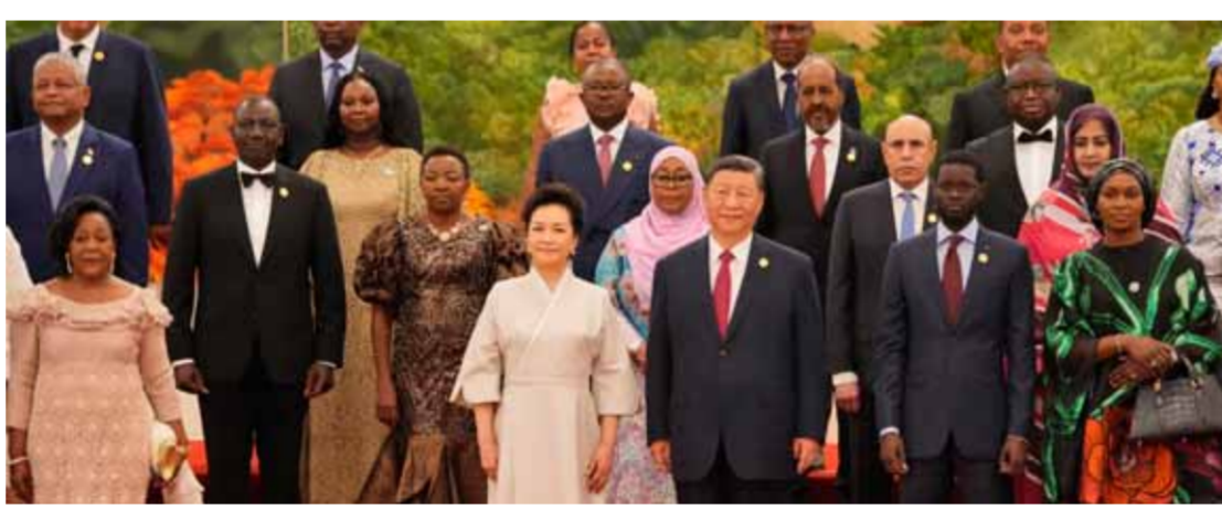
الرئيس الصيني شي جين بينغ وزوجته يتوسطان زعماء من الدول الإفريقية خلال منتدى التعاون الصيني الإفريقي

شرق إفريقيا. وفي سياق متصل، أكد رئيس الوزراء المصري مصطفى مدبولي أن منتدى «فوكا» أثرى العلاقات الصينية- الإفريقية وحقق نتائج مثمرة، مشيراً إلى أن علاقات التعاون بين مصر والصين يطبق عليها شعار تحقيق المكاسب للجميع من دون استثناء طرف على حساب الآخر، مبيناً طموح مصر لاستمرار هذا التطور في العلاقات بل تعظيمه في المستقبل القريب. وأشار مدبولي في حديث لوكالة «شينخوا» إلى أن مصر ستواصل العمل مع بكين لتهدئة حدة التصعيد وعدم الاستقرار في