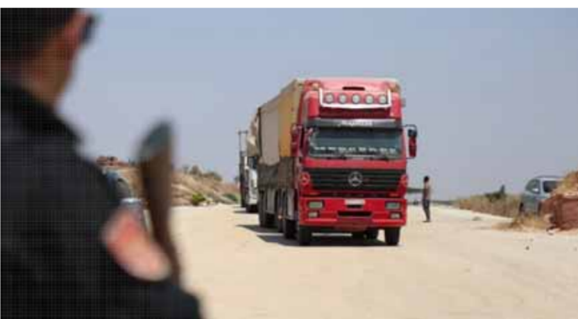
استمرار إغلاق منفذ «أبو الزندين» بعد مضي ٣ أسابيع على وضعه في الخدمة رسمياً

أبلغت الحضور بأن الحركات الاحتجاجية، كالتجري في «أبو الزندين» مخالفة لتوجيهات أنقرة وتمس بالاستقرار الأمني في مناطق هيمنتها في الشمال السوري، ولذلك لا بد من إحداث تغييرات جذرية في بنية المعارضة العسكرية والأمنية لضبط الاحتجاجات من هذا النوع، وعدم ترك الجبل على الغري وفي سفوفه وفيلق والديوير بريف ادلب، واستهداف بالطيران المسير تحركات مؤلفة للمسلحين ونقاط ارتكازهم في بيئين.