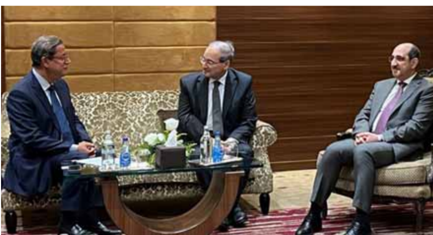
وزير الخارجية والمغتربين في حكومة تسيير الأعمال خلال لقائه المدير العام لـ «إيكاردا»

الولايات المتحدة باحتجاز طائرة الرئيس الفنزويلي نيكولاس مادورو في جمهورية الدومينيكان، مؤكدة أن هذا السلوك هو عملية قرصنة دولية وانتهاك صارخ للمبادئ والقواعد الأساسية للقانون الدولي.