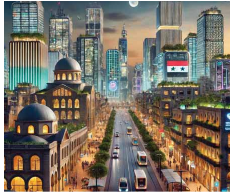
مصدر الصورة «النكاه الاصطناعي»

يس على المشروع الأول في المنطقة فهو موجود في كثير من الدول وخاصة العربية مثل الإمارات العربية المتحدة، المملكة العربية السعودية وليتان ومصر والأردن لكن وجوده في سورية ضرورة حتمية من أجل خلق فرص عمل جديدة، وتوفير مصدر جديد للإيرادات أكان للحكومة السورية أم للقطاع الخاص مع تنظيم عمل القطاع التكنولوجي في سورية بشكل احترافي وهو ما بطور آنية هذا العمل ويجعله أكثر واثقاً.