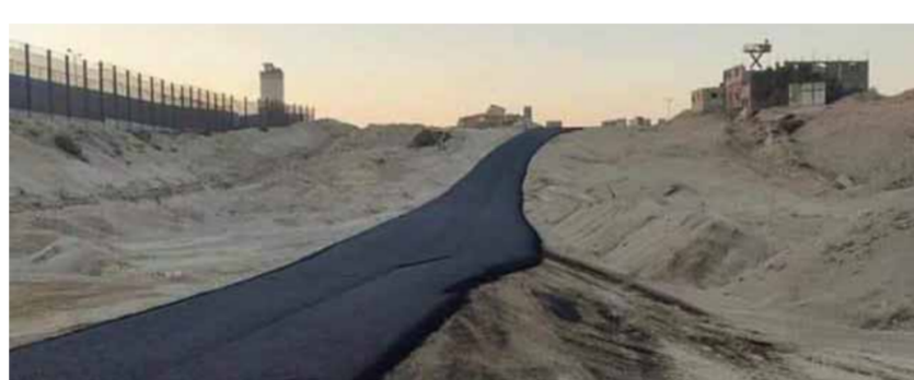
قوات الاحتلال الإسرائيلي تقوم بتعبيد طريق في محور فيلا دلفيا