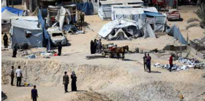
فلسطينيون يتفقدون موقع القصف الإسرائيلي على مخيم مؤقت للنازحين في المواصي جنوب قطاع غزة (أ ف ب)

لكن الاحتلال سيقوم بكل ما بوسعه لتدمير الضفة». عبد الهادي اعتبر أن المشكلة ليست بنتيهاهو وإنما بمن يركب قنيتها وهي الإدارة الأميركية العميقة التي لديها سياسة الهمزة والسطرة، مشيراً إلى أن الخطر الأكبر عندما يأتي «المرشح الجمهوري والرئيس الأميركي السابق دونالد ترامب» الذي أعلن صراحة بأنه عندما يترشح «الخراطة الإسرائيلية» وجدها صافية بمعنى أنه عند وصوله إلى الرئاسة سيسمح لإسرائيل بضم الضفة الغربية لكن ضم الضفة سيكون مثل ما يقول المثل الشعبي إنه وضع بذور نهايته بيده لأنه لا يمكن أن يستقل الشعب الفلسطيني من دون إقامة دولته، والفلسطينيون يقاومون منذ أكثر من 80 عاماً وهم مستعدون للاستمرار بالمقاومة إلى 100 عام قادمة، ولن يرضخوا للسياسة الإسرائيلية، وأضاف: «نحن صامدون ولن نعطي التراجع للاحتلال الإسرائيلي لكننا جازمون للدفاع عن أرضنا بشتى الوسائل ونحن الآن نصبر لكي تكشف كذب الغرب ونعطي الفرصة الأخيرة للغرب الذي يعان أنه يجب إقامة الدولة الفلسطينية على خط الرابع من حزيران وعاصمتها القدس فأين هم اليوم مما يجري وهذه فرصة الغرب لكي يثبت إما أنه صادق أو كاذب، ونحن نشجع فلسطيني نقول: إن القضايا العربية مترابطة وتدعو لموثرت دولي للسلام وانسحاب إسرائيل من كل الأراضي العربية في الجولان ولبنان والضفة وغزة، وعندما يمكن أن يتم السلام، وغير ذلك لا أكبر».