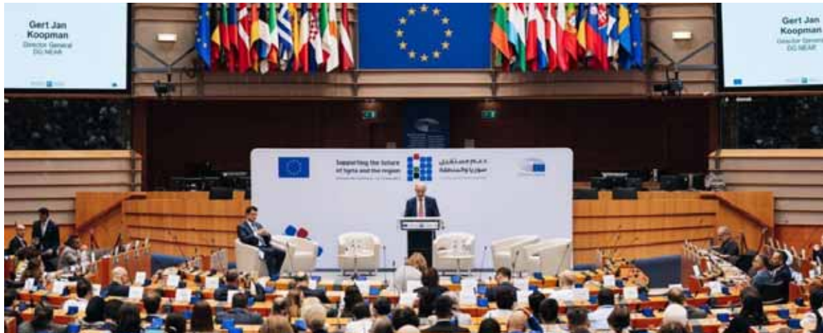
من مؤتمر بروكسل الأخير الذي شهد دعوات من ثماني دول لمراجعة سياسات الاتحاد الأوروبي الخاطئة تجاه سورية (عن الانترنت)

المستهدفة؟ ونظراً لأن الإقناع الأخلاقي لا يكفي، فما الآلية التي يمكنها تصورها لمواجهة هذا الامتثال المفرط بشكل فعال؟ يذكر أن إيطاليا أعلنت نهاية تموز الماضي استئناف عملها الدبلوماسي في سورية، لتصبح أول دولة من مجموعة الدول السبع الصناعية الكبرى التي تستأنف عمل بعثتها الدبلوماسية في دمشق وعينت المبعوث الخاص لوزارة الخارجية الإيطالية ستيفانو رافانين سفيراً لها، ووفق مصادر صحفية في العاصمة الإيطالية روما، فإن السفير الجديد سيصل دمشق فور موافقة البرلمان الإيطالي على تعيينه، وهي مسألة وقت وهو إجراء متبع لتعيين كل السفراء، وقد يحصل السفير الجديد على اعتماده خلال الشهر القادم.