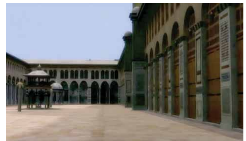
محاكاة الجامع الأموي الكبير

ماذا يحتاج العمل الفني كي يقنع الجمهور وكيف تتم عملية الإقناع برأيك؟ البحث عن المعلومة والمتابعة الحثيثة في كل تفصيل ومن عدة مصادر ويكون الفنان على اطلاع يومي