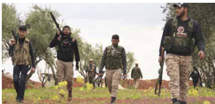
إرهابيون من «الجبهة الشامية»

حزب الله بدوره أعلن استهداف مواقع وتكتات الاحتلال الإسرائيلي على طول الحدود اللبنانية مع فلسطين المحتلة، حيث هاجم انتشاراً لجنود الاحتلال في محيط تكتة منات وتوضعا لهم في محيط