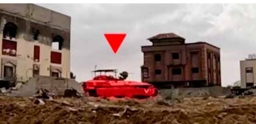
المقاومة تواصل التصدي لقوات الاحتلال الإسرائيلي واستهداف جنوده وألياته في غزة (عن الانترنت)

إيصال المساعدات إلى غزة استمع خلالها الأعضاء إلى إحاطة من كبيرة منسقي الأمم المتحدة للشؤون الإنسانية وإعادة الإعمار في غزة سيفريد كاخ. وقدمت كاخ تقييماً للوضع في غزة وصفته بأنه «كئيب ومخزن»، مؤكدة «المسؤولية العميقة» التي يتحملها المجتمع الدولي في معالجة مأساة هذه الحرب. بدوره، دعا مندوب الجزائر إلى ضرورة مواجهة الواقع المرير وإيصال المساعدات إلى سكان قطاع غزة، التي انخفضت مؤخرًا وتكسب المآزق السياسي المستعصي بسبب سلطات الاحتلال.