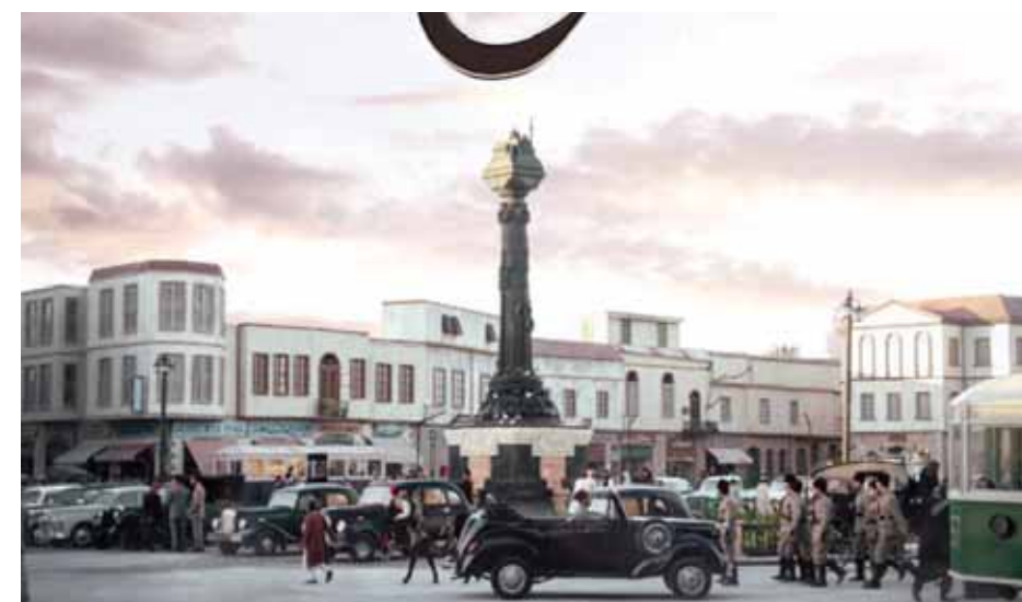
محاكاة ساحة المرجة من مسلسل «تاج»

كيف يحقق النجاح صانع المؤثرات البصرية في مهمته الفنية وعلى أكمل وجه؟