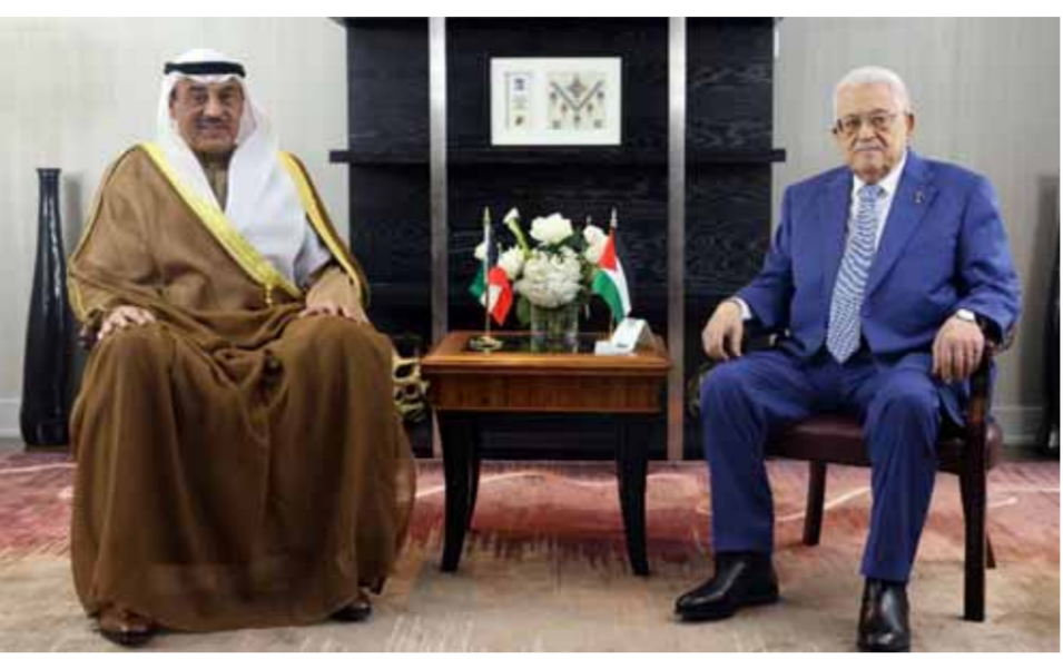
الرئيس الفلسطيني محمود عباس خلال لقائه في العهد الكويتي صباح خالد الحمد الصباح أمس

الأيام الكويتية كوبنا. قرار الجمعية العامة للأمم المتحدة الداعي لإنهاء وجود الاحتلال والاستعمار وتبلد الشعب الفلسطيني حربته العالني بوجج بريده، إذ تحرك المجتمع الدولي لتنفيد