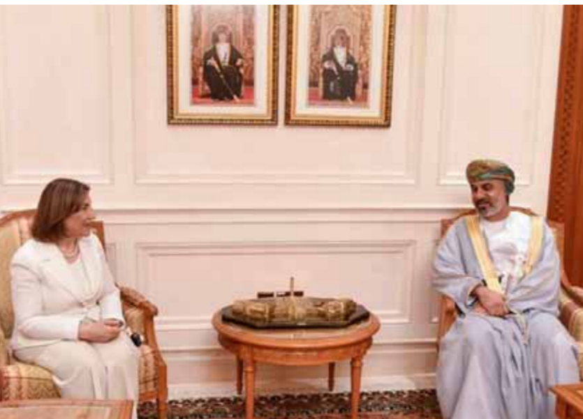
رئيس مجلس الشورى العماني خالد بن هلال بن ناصر المعولي يستقبل المستشارة الرئاسية بنية شعبان

بلندا، وجدنا أن الفرق مئة بالمئة بين رواية الناس التي عاشت الحرب وبين رواية الغرب وهذه دلالة على أنه يتوجب علينا أن نسجل تاريخنا ونوثقه كما عشناه وليس كما رواه عنا الآخرون». ولغفت شعبان إلى أن العيش المشترك هو القيمة العليا التي يجب أن نحافظ عليها وعمان تمثل جانباً مشرقاً في هذا الإطار.