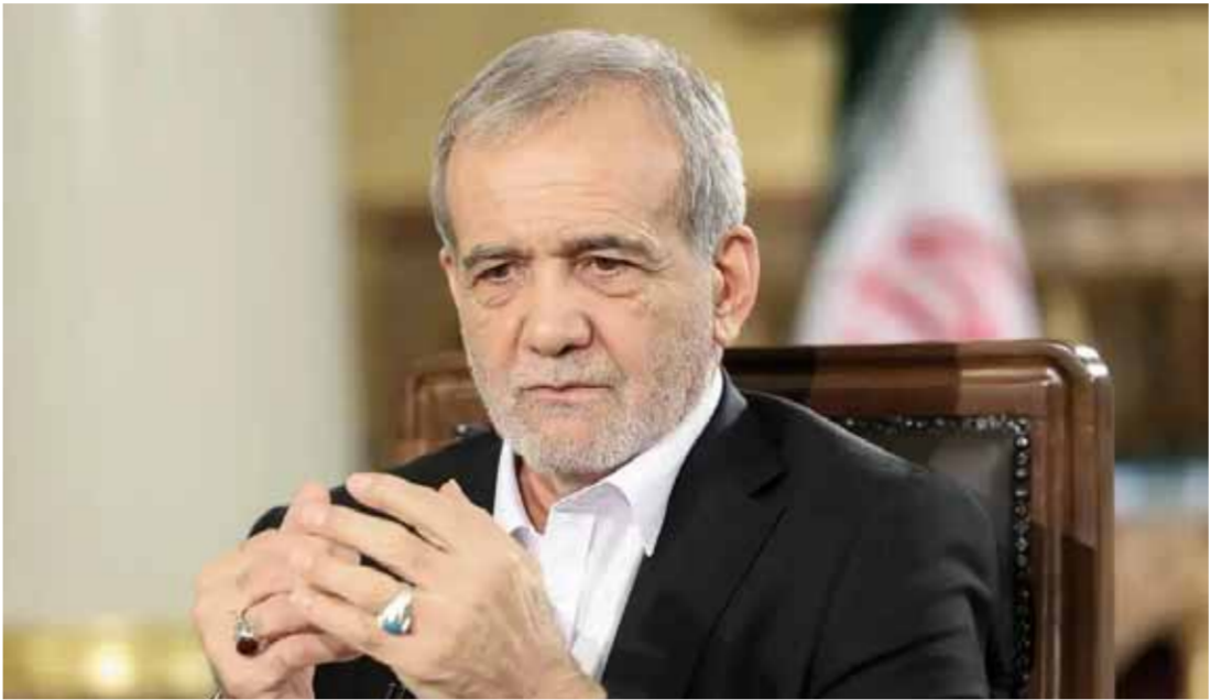
الرئيس الإيراني محمود باسجود بزشكيان

المخند، ومن الطبيعي أن نقد اجتماعات مع رؤساء الدول القطرية وسعدت مع هذه الأخر والأحوال السلام والأمن في العالم. وصباح أمس الأحد، توجهه بزشكيان في رأس قد سياسي وفق السنوي إذ جاء على الصلح للمشاركة في أعمال الدورة الـ٧٤ للجمعية العامة للأمم المتحدة، وشرع وزع إيران من القطرية الغربيين، وليني الرئيس الإيراني كلته أحد الجمعيات العامة للأمم المتحدة صباح عد الثلاثاء كما يعد على ما جرى اليوم في ميدان التحرير الحكومة الإيراني، في ظلها سيتم المزيد من تعميق