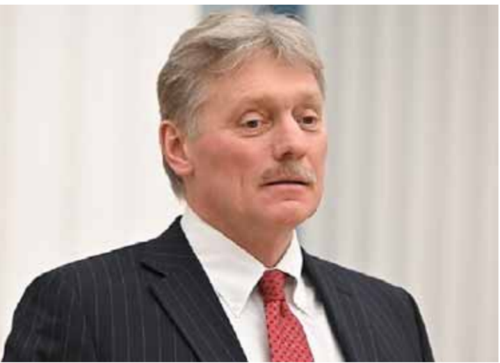
المتحدث باسم الرئاسة الروسية دميتري بيسكوف.

لماتلثة مقرحات جيدة تأخذ بمن الاعتبار الوضع على الأرض وواقع الجيوسياسي والمباردة التي فدتها الرئيس فلاديمير بوتين بهذا الصدد في ١٤ من حزيران الماضي، وسبق أن أصدرت خارطوة، وقالت زاخاروفا في تصريحاتها للصحفيين إن ممتلئ روسيا لم وأخذ مصالحتها على الاعتبار، لكن كيف والغرب لا يفكران في السلام، وبما جناهة قبل الحرب والتأكد على ذلك هو الهجوم الإجمالي للقوات الأوكرانية على مقاطعة