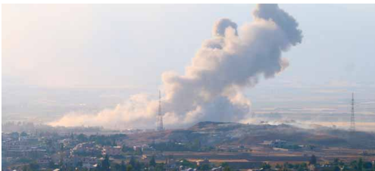
قصف إسرائيلي مكثف يوم أمس على مختلف أرجاء لبنان

مدى القصف إلى 120 كم». سياسياً، أدانت سورية بأشد العبارات الهجوم، وأعربت عن تضامنها الكامل مع الشعب اللبناني في مواجهة هذا العدوان وعن ثقها بأن المقاومة اللبنانية لن تكسر أو تتحيد عن بولصتها. وفي بيان نشرته على صفحتها الرسمية أمس، قالت وزارة الخارجية والمغتربين: «إمعاناً في حرب الإبادة الجماعية التي يشنها العدو الإسرائيلي على المنطقة، يواصل هذا الكيان الغاصب سفك دماء الأبرياء وارتكاب المجازر بحق المدنيين العزل يومياً، في سابقة لم يشهد التاريخ الحديث مثيلاً لها». رئيس حكومة تصريف الأعمال اللبنانية نجيب ميقاتي وصف العدوان على بلاده بأنه حرب إبادة ومخطط لتدمير القرى والبلدات اللبنانية، ودعا المجتمع الدولي إلى الوقوف مع الحق، وردع هذا العدوان، في حين أعربت روسيا عن قلقها لأن الوضع في الشرق الأوسط يتدهور بسرعة ويصعب التنبؤ بتبعات الصراع، كما أدانت إيران بشدة الغارات الجوية الواسعة للكيان الصهيوني، وقال وزير خارجيتها عباس عرقجي: «طهران ستدافع وستدعم لبنان بشكل كامل».