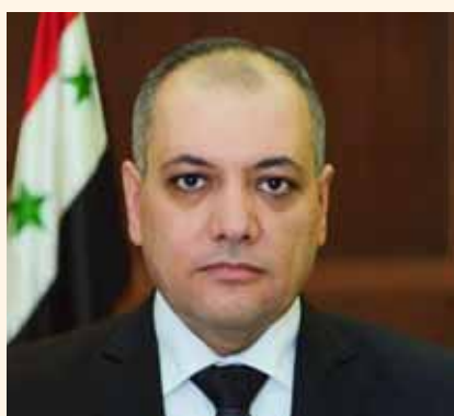
محمد غازي الجلاي

وزير دولة وسمر السباعي وزيرة للشؤون الاجتماعية والعمل وحمزة علي وزيراً للأشغال العامة والإسكان وزياد غصن وزيراً للإعلام. وأصدر الرئيس الأسد أمس مرسوماً آخر بتسمية فيصل المقداد نائباً لرئيس الجمهورية مفضلاً بمتابعة تنفيذ السياسة الخارجية والإعلامية في إطار توجهات رئيس الجمهورية. وفي الرابع عشر من الشهر الجاري، أصدر الرئيس الأسد مرسوماً يقضي بتكليف الجلاي بتشكيل الوزارة في سورية، خلفاً للمهندس حسين عرنوس الذي شغل منصب رئيس مجلس الوزراء منذ 30 آب 2020.