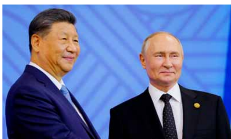
الرئيسان الروسي فلاديمير بوتين ونظيره الصيني شي جين بينغ خلال قمة بريكس (أ ف ب)

المتمثل في ارتفاع الجنوب العالمي والاستجابة بنشاط لطلبات الدول بشأن الانضمام إلى الية تعاون «بريكس»، وقال: يعد توسيع العضوية معلما مهما في مسيرة تطور «بريكس»، وحدثاً فاصلاً في ظل تغيرات الأوضاع الدولية، قريبا في هذه القمة دعوة العديد من البلدان لتصبح شريكاً لبريكس، وذلك بعد تقدمها مهما وجدياً لعملية تطور المجموعة. ولفت الرئيس شي إلى أن العالم دخل في مرحلة جديدة من الاضطراب والتحول ويواجه خيارين وهما إما ترك العالم في حالة الاضطراب وإما إعادته إلى الطريق المستقيم من السلام والتنمية، معتبراً أنه كلما زادت شدة الرياح والأمواج، زادت ضرورة الوقوف في الصف الأول لبناء مجموعة بريكس كي تصبح القناة الرئيسية لتعزيز التضامن والتعاون بين دول «الجنوب العالمي» والقوة الرائدة للدفع بإصلاح الحوكمة العالمية. وعلى هامش الاجتماع التقى الرئيس الروسي بنظيره الإيراني مسعود برنجنان، الذي أشار خلال اللقاء إلى ضرورة كسر الحظر الأميركي على البلدين، وتعزيز علاقاتها السياسية والاقتصادية والثقافية والعلمية، مضيفاً: أتمنى أن نوقع مذكرات واتفاقيات قريباً، وإنني عازم على متابعة هذه المذكرات بنفسى ووضع المسلمات النهائية، والتوقيع عليها في أقرب وقت ممكن. الرئيس الروسي من جهته قال وجهات نظر روسيا وإيران بشأن القضايا الدولية والإقليمية واحدة أو على الأقل متقاربة، وأضاف: روسيا وإيران ستوقعان قريباً اتفاقية التعاون الاستراتيجي الشاملة.