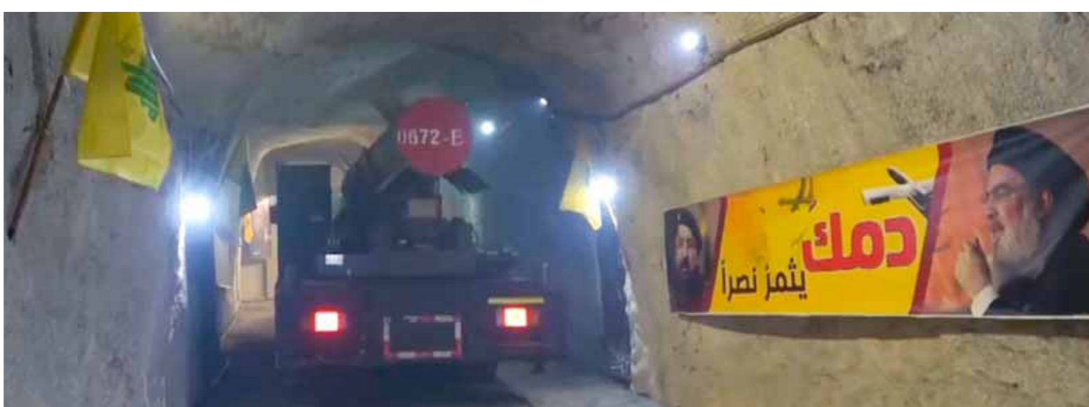
من عملية استهداف المقاومة قاعدة غيلوت في ضواحي تل أبيب بصواريخ «قادر ٢»

مكتب صحفي معروف لقناة إعلامية معروفة. وفي قطاع غزة وخاصة في شماله الذي لا يزال محاصراً لليوم الـ19 في ظل القصف الجوي والمدفعي المكثف عليه، واصلت قوات الاحتلال الإسرائيلي حرب الإبادة الجماعية واستهداف كل ما يتحرك، إضافة إلى التهجير القسري ونسف المنازل ومراكز الإيواء والمدارس، وسط نفاذ الأوكسان والمستلزمات الطبية من المستشفيات وأعلنت وزارة الصحة الفلسطينية في بيان أمس أن الاحتلال الإسرائيلي ارتكب خلال الساعات الـ24 الماضية 6 مجازر في قطاع غزة، راح ضحيتها 74 شهيداً و130 جريحاً، مشيرة إلى أن عدد ضحايا عدوان الاحتلال المتواصل لليوم الـ383 على القطاع ارتفع إلى