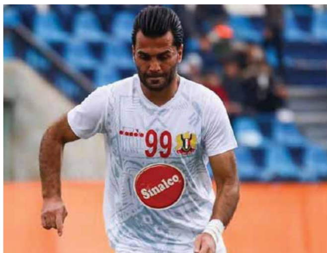
من فوز الوثبة