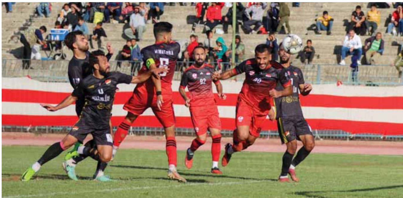
من فوز الوثبة