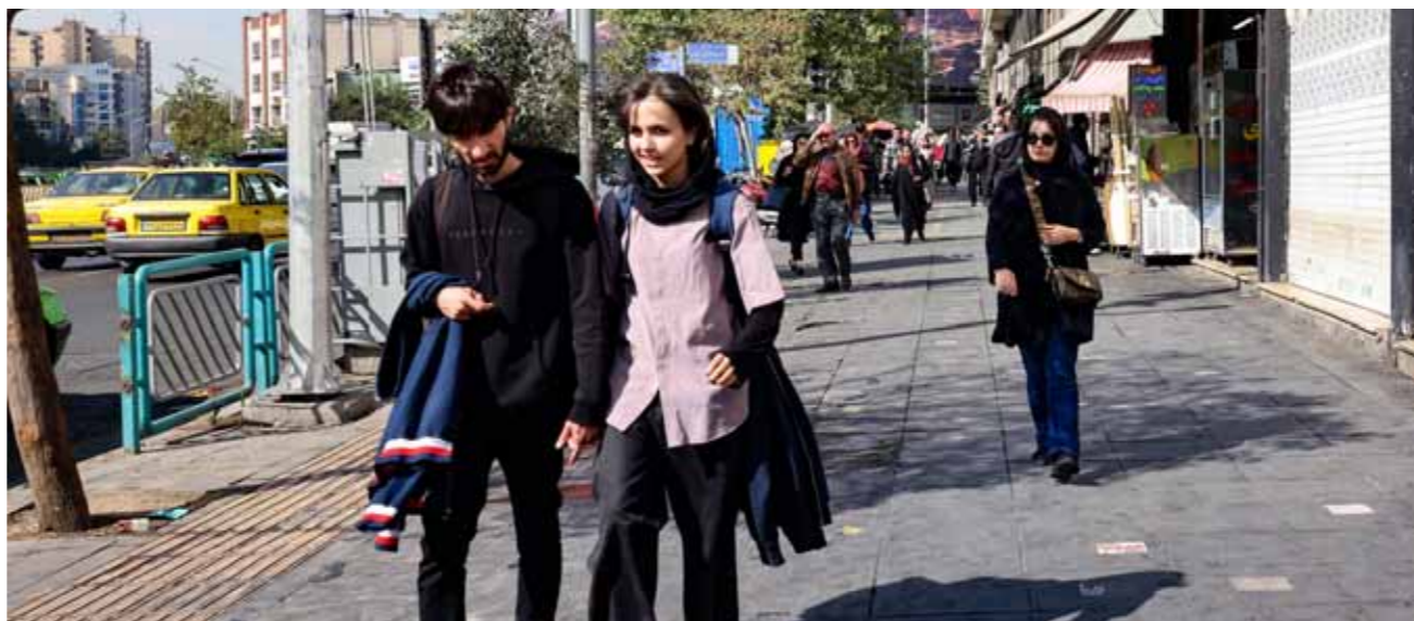
حياة طبيعية في بيت لاهيا بعد العدوان الإسرائيلي (الفاشل) أمس (1 أ ب)

في السياق، أعلنت هيئة الطيران في إيران استئناف الرحلات الجوية في البلاد، كما أكدت شرطة المرور الإيرانية أن حركة المرور في طرق البلاد كلها تسير بصورة طبيعية، كذلك أعلنت مضافة النفط في طهران أن العدوان الصهيوني لم يستهدف أي منشأة في المصفاة، وأن عملية الإنتاج تسير بصورة طبيعية. وقبل ذلك، أكدت العلاقات العامة للدفاع الجوي الإيراني في بيان أمس نجاح أنظمة الدفاع الجوي في التصدي لمحاولات الكيان الصهيوني استهداف عدة مواقع في محافظات طهران وخوزستان وإيلام، مبيئة أن بعض النقاط تعرضت لأضرار محدودة بفعل العدوان، وأن التحقيق جارٍ في أبعاد الحادث، كما دعت الشعب الإيراني إلى التضامن والهدوء وعدم الالتفات إلى ما تشهيه وسائل إعلام الاحتلال عن هذه الحادثة، في حين أعلن