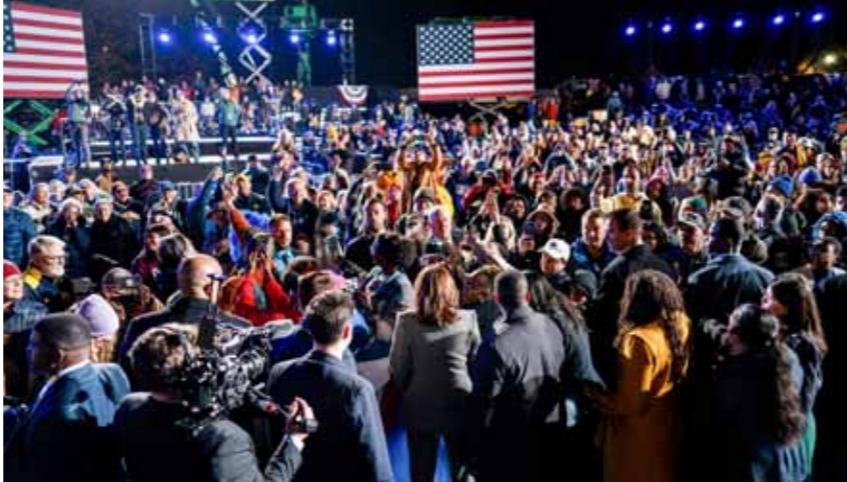
تجمع انتخابي للمرشحة عن الحزب الديمقراطي كاميليا هاريس في ولاية ميشيغان (أ ف ب)

«غير كقوة ولم تكترت بدوريات المراقبة طوال 4 سنوات ولم تحاول الاتصال بهم»، ووصف ما قامت به بأنه «خيانة بدم بارد»، فقتت الحدود على مصراعها، حيث يأتي المهاجرون من دول غير معروفة».