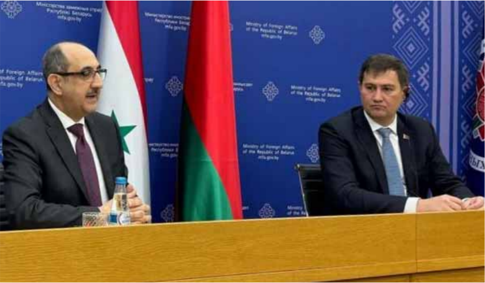
وزير الخارجية والمغتربين بسام صباغ خلال لقائه نظيره البيلاروسي مكسيم ريچينكوف في مينسك (عن الانترنت)

الخارجية في كلا البلدين، إضافة إلى بحث تعزيز التعاون في المجالات الاقتصادية والثقافية والإنسانية. وأشار صباغ إلى أنه أطلع وزير الخارجية البيلاروسي على تداعيات الاعتداءات الإسرائيلية المتكررة على الأراضي السورية، وكذلك العدوان الإسرائيلي المستمر على الفلسطينيين واللبنانيين، مؤكداً موقف سورية الثابت بضروة وقف هذا العدوان فوراً، وإنهاء الاحتلال الإسرائيلي المستمر للأراضي العربية المحتلة، بما فيها الجولان السوري المحتل، وإدانة جرائم الحرب والإبادة الجماعية التي ترتكبها قوات الاحتلال الإسرائيلي، والمطالبة بحسابة مرتكبيها وضمان عدم إفلاتهم من العقاب.