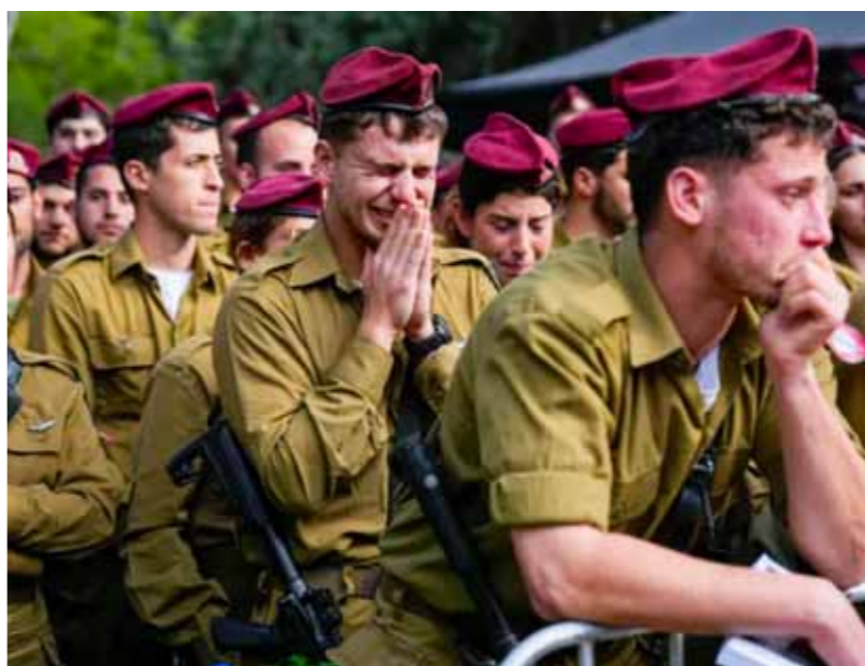
قتلى وجرحى جيش الاحتلال الإسرائيلي قارب الـ ٩٠٠ (عن الانترنت)

وقاسم من مواليد بيروت عام 1953، وهو من نواة المؤسسين لـ«حزب الله» عقب الاجتياح الإسرائيلي للبنان في 1982، وانتخب في مجلس شورى الحزب ثلاث مرات وتولى مسؤولية قطاعات مختلفة بينها المجلس التنفيذي والأنشطة التربوية وغيرها.