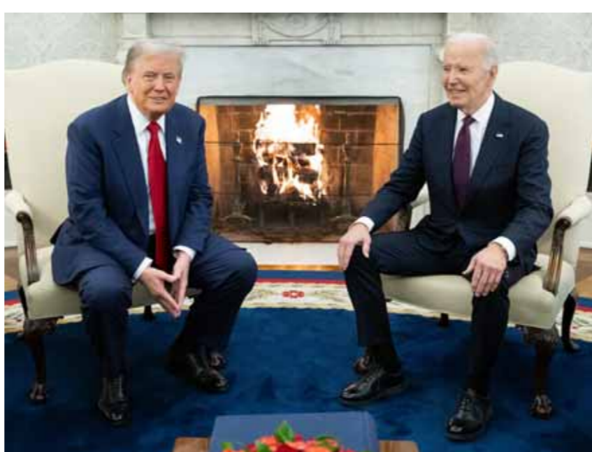
من لقاء الرئيسين جو بايدن و دونالد ترامب في البيت الأبيض

فيقيد راماسوامي «وزارة قضاء الحكومة» الجديدة، فيما سيتولى ماركو روبيو منصب وزير الخارجية، وبيت هيغسيت منصب وزير للدفاع وهو شخصية عسكرية سابقة ويعمل حالياً كمديع في شبكة فوكس نيوز. بالترامب انتخب الجمهوريون في مجلس الشيوخ الأميركي، السناتور جون ثون، لمنصب زعيم الأغلبية في المجلس للعامين المقبلين ليحل محل ميتش ماكونيل الذي سيتنحى في كانون الثاني المقبل. وفي وقت سابق أمس كان تحدث ترامب عن فرضية