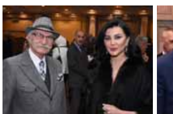
النجمان حسام تحسين بيك وجيني اسبر