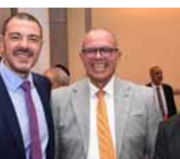
السفير البرازيلي بتوسط السفير الكوبي والسفير المصري