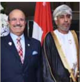
سفيرا سلطنة عمان والبحرين