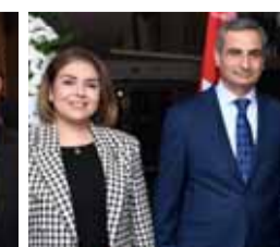
.. ومع وزير الإعلام ووزيرة الثقافة