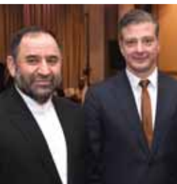
سفير فنزويلا والسفير الإيراني