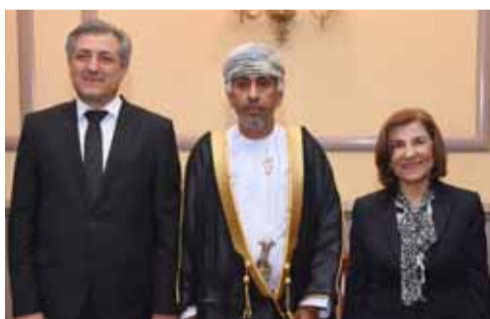
السفير العماني بتوسط المستشارة الرئاسية الخاصة ومحافظ دمشق