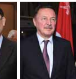
سفيرا سلطنة عمان وروسيا الاتحادية