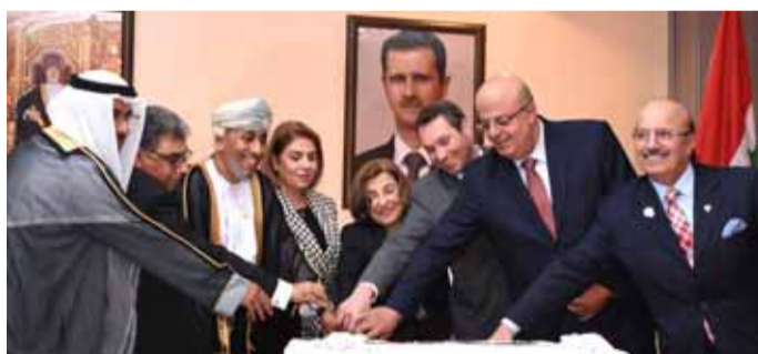
أثناء تقطيع قالب الحلوى