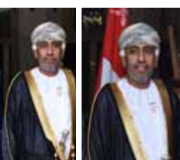
رئيس منظمة الهلال الأحمر وسفير عمان