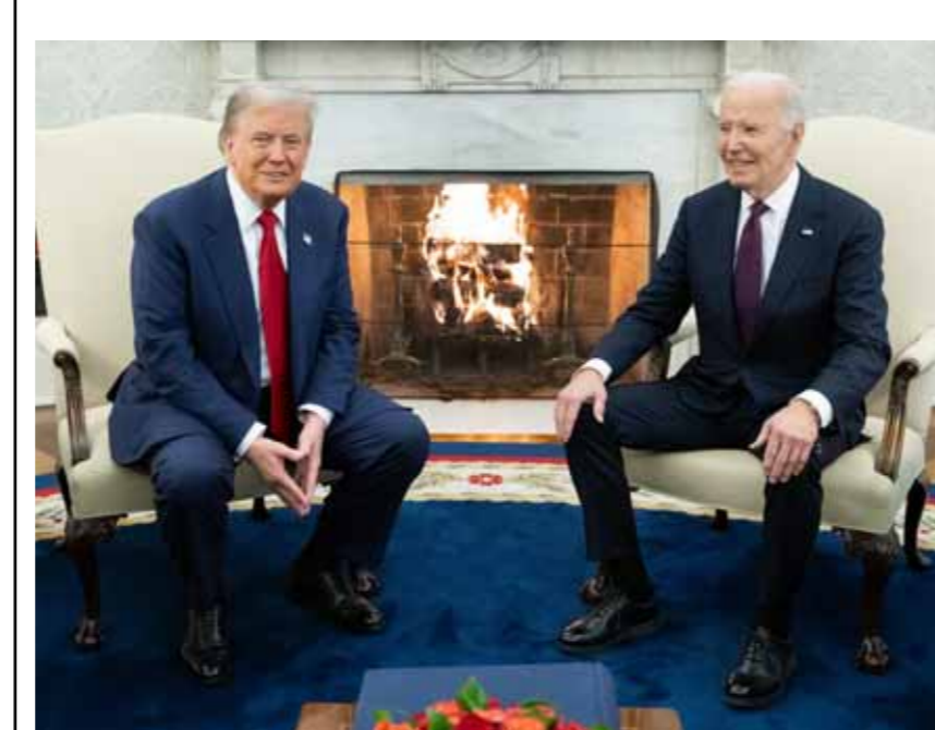
من لقاء الرئيس جو بايدن و دونالد ترامب في البيت الأبيض (أ ف ب)

فيقك راماسوامي «وزارة فضاء الحكومة» الجديدة، فيما سيتولى ماركو روبيو منصب وزير الخارجية، وبيت هيغسيت منصب وزير للدفاع وهو شخصية عسكرية سابقة ويعمل حالياً كمدير في شبكة فوكس نيوز. بالترامب انتخب الجمهوريون في مجلس الشيوخ الأميركي، السناتور جون ثون، لمنصب زعيم الأغلبية في المجلس للعامين المقبلين ليحل محل ميتش ماكونيل الذي سيتنحى في كانون الثاني المقبل. وفي وقت سابق أمس كان تحدث ترامب عن فرضية