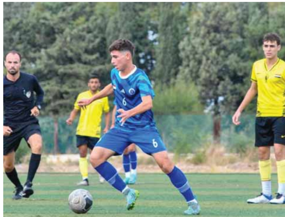
من ديربي حطين وتشرين

وضمنت فرق الجيش والشرطة والوحدة والكرامة والوثبة والوافدين والجديدين الجهاد والغرات اللذين صعدا عوضاً عن فريقين الساحل والجزيرة.