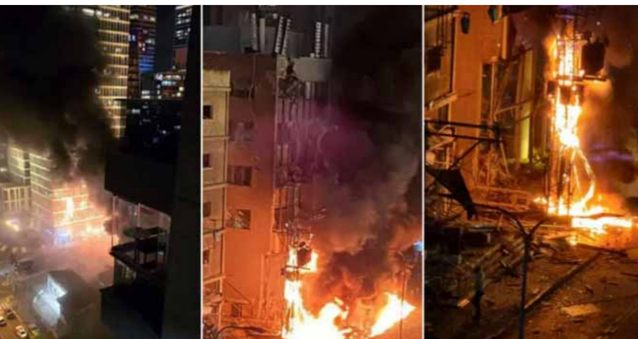
استهداف صاروخي لتل أبيب وبعض الإصابات فيها خطيرة

ويعد إشاعة الإعلام الإسرائيلي بأن المبعوث الأمريكي أجل قدومه إلى لبنان، أكد رئيس البرلمان اللبناني نبيه بري في اتصال مع صحيفة «الشرق الأوسط» السعودية، بأن الزيارة في موعدها الثلاثاء، مستغرباً كل ما أشيع عن لغائها وتسبب في تبديد التفاوض الذي ساد الأجواء الإيجابية التي يبني عليها تقديم الحل السياسي على الخيار العسكري. في غضون، أكد عضو كتلة «التمنية والتحرير» النائب اللبناني قاسم هاشم، أن «الأجواء إيجابية بشأن التفاوض والرد اللبناني على مسودة اتفاق وقف إطلاق النار في لبنان»، مشيراً إلى أن «الأمر على خواتمها، خصوصاً مع هذا العدو الإسرائيلي الذي طالما تنصل من التزاماته»، حسبما نقل موقع «النشرة» الإلكتروني اللبناني. وركز هاشم في حديثه إداًعي، على «ضرورة أخذ التطورات الأخيرة بالحسبان عند تقييم نيات العدو» للحفاظ على السلام.