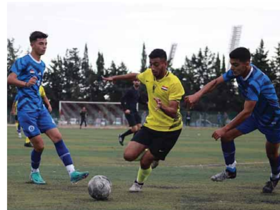
من لقاء تشرين والكرامة