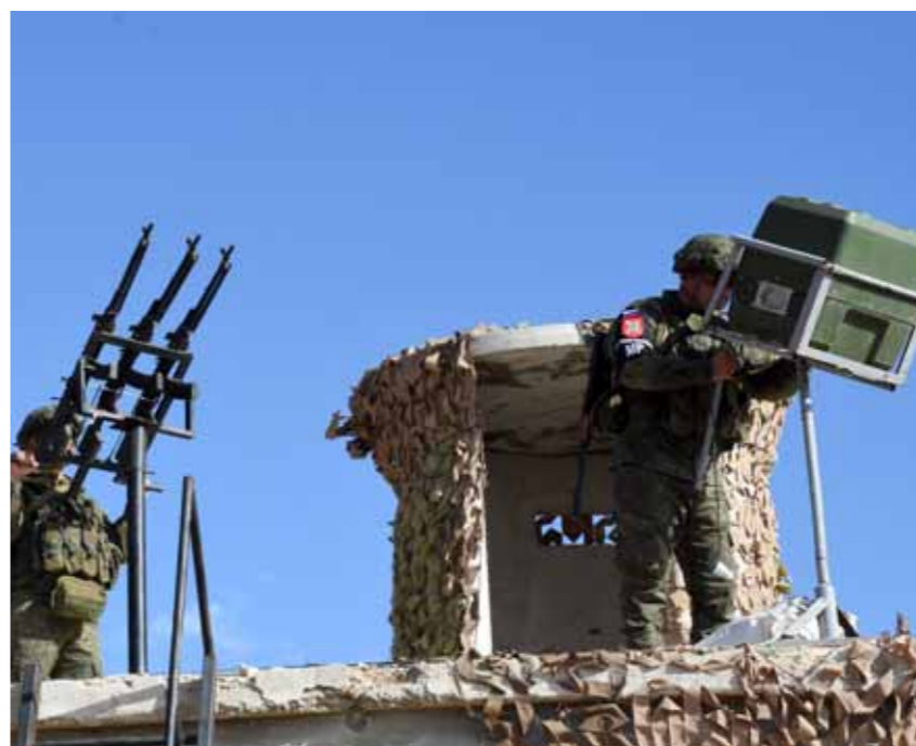
جنود روس في نقطة مراقبة في القنيطرة

السوري أن نشر وحدات الشرطة العسكرية الروسية الصديقة على طول «خط فض الاشتباك» يعزز الاستقرار والأمن مشيراً إلى أن التعاون والتنسيق بين الجيش العربي السوري والقوات الروسية وتبادل المعلومات والخبرات بينهما رسخ الأمن والاستقرار في المنطقة، وساعد الأهالي على العودة إلى أراضيهم، وممارسة حياتهم الطبيعية في قراهم ومناطقهم بعد تحريرها من الإرهاب. وأضاف: «هذا الأمر نتج عن عملية تطهير المنطقة من المجموعات الإرهابية، إضافة إلى إعادة الأمن