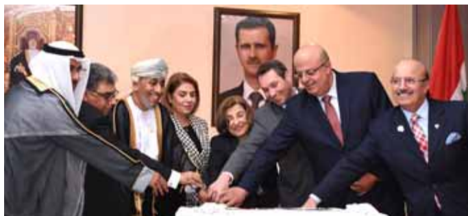
أثناء تقطيع قالب الحلوى