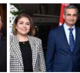
.. ومع وزير الإعلام ووزيرة الثقافة