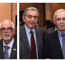
سفيرا فلسطين والجزائر