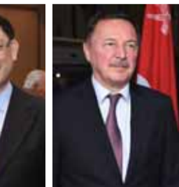
سفيرا سلطنة عمان وروسيا الاتحادية