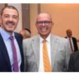
السفير البرازيلي يتوسط السفير الكوبي والسفير المصري