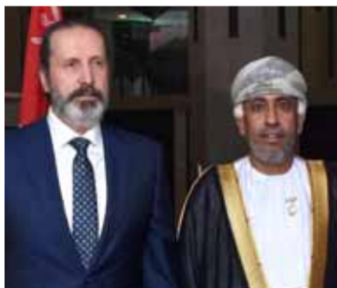
السفير العماني وأمين عام رئاسة الجمهورية