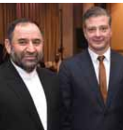
سفير فنزويلا والسفير الإيراني