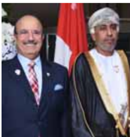
سفيرا سلطنة عمان والبحرين