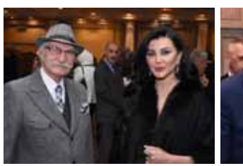
النجمان حسام تحسين بيك وجيني اسبر