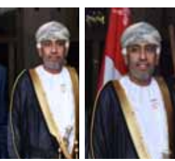
رئيس منظمة الهلال الأحمر وسفير عمان

سيفلا رزوق  أقام سفير سلطنة عُمان في سورية تركي بن محمود البوسعيدي حفل استقبال بمناسبة الذكرى الرابعة والخمسين للعيد الوطني لسلطنة عُمان في فندق داماروز بدمشق. حضر الحفل الأمين العام لرئاسة الجمهورية منصور عزام، والمستشارة الخاصة في رئاسة الجمهورية بثينة شعبان ووزراء الاقتصاد والتجارة الخارجية محمد ربيع قلعه جي والثقافة ديالا بركات والإعلام زياد غصن، ومحافظ دمشق طارق كريشاتي.