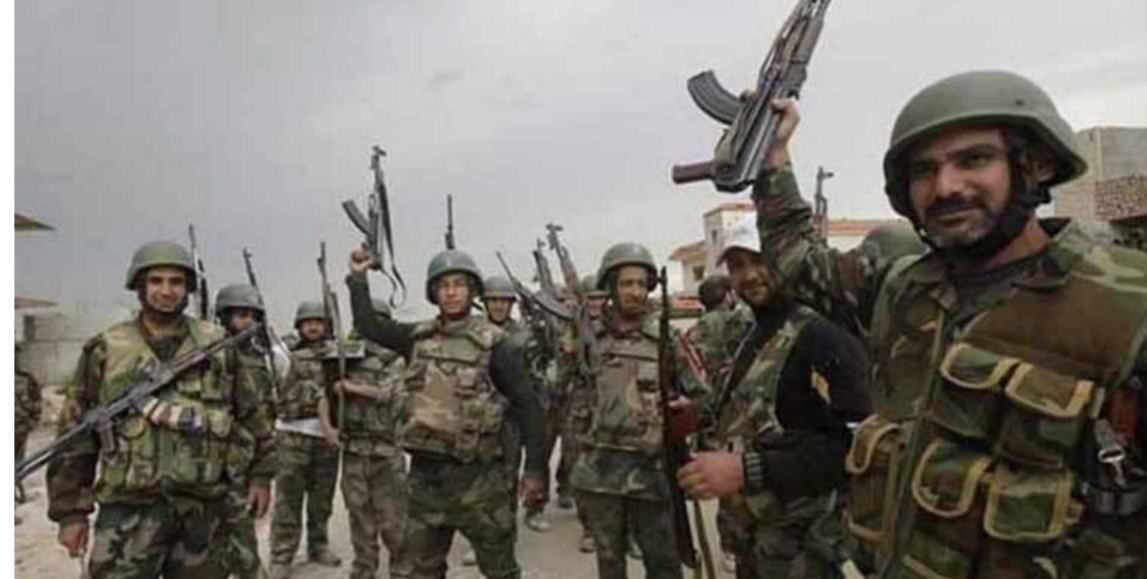
تعزيزات للجيش العربي السوري إلى ريف حماة الشمالي

وهكذا، وبعد توقف المنطقة الصناعية في حلب عن الإنتاج وبالتالي استهلاك الكهرياء، ومن ثم تخصيص فتح باب الاستضافة للطلاب القادمين من الجامعات فتح باب الاستضافة للطلاب القادمين من الجامعات، وممنح الطلاب في الجامعات والمعاهد الحكومية التي يرغبون بالدراسة بها، ومنح الطلاب المسجل في الجامعات المضيفة وثيقة تأجيل خدمة العلم من الجامعة المضيفة، واستضافة الموظفين والإداريين وأعضاء الهيئة التعليمية للسكان وينشرون ويروجون ويحاولون إقناع