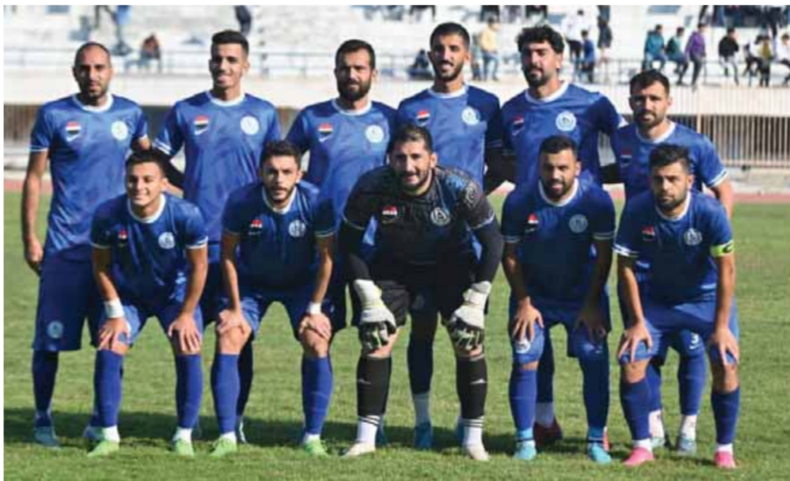
جيلة في المباراة الأخيرة

هجومي كالرمضان وهو ما يمكنهم من صفل أهدافهم والقدرة على إحراز الأهداف بكثرة.