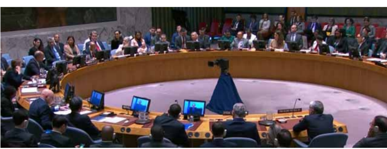
جلسة طارئة لمجلس الأمن أمس لمناقشة تداعيات الهجوم الإرهابي على الشمال السوري

في غضون، أعلن مستشار قائد الثورة الإسلامية للشؤون الدولية علي أكبر ولايتي أن تركيا وقعت في الفخ الذي حفرت له أميركا وإسرائيل، وقال: على أميركا، والصهاينة، والدول الإقليمية، سواء كانت عربية أم غير عربية، أن يطموا أن الجمهورية الإسلامية الإيرانية ستواصل دعمها المطلق للحكومة السورية حتى النهاية.